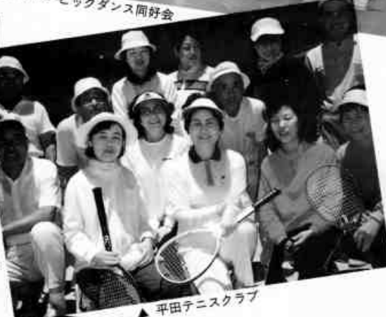
▲ 平田テニスクラブ