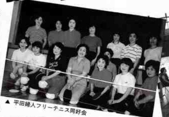
▲ 平田婦人フリーテニス同好会