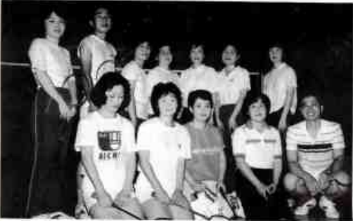
▲ 平田バドミントン同好会