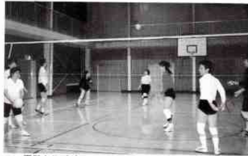
▲ 平田クラブ (バレーボール)

発行所 平田地区自治会連合会 ひらた新聞編集部 (岩国市平田出張所内) 岩国市平田3丁目22-18 印刷所 フジ美術印刷 岩国市今津町2丁目2-52