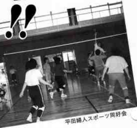
平田婦人スポーツ同好会