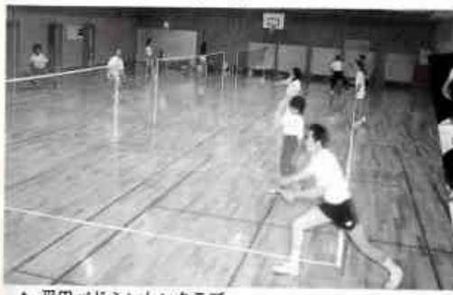
▲ 平田バドミントンクラブ