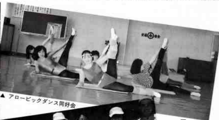
▲ アロビックダンス同好会